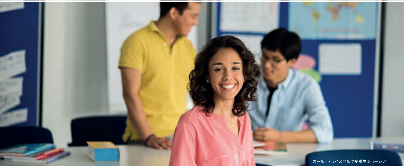
カール・デュイスベルク受講生ジョージア